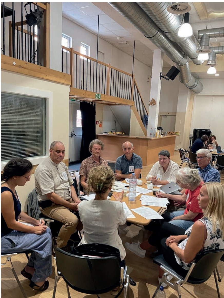
Arbeidsgruppene var gode arenaer for utveksling av informasjon

Det blei under gruppearbeida nemnt at også leverandørindustrien kan vera ein viktigare aktør enn det er nå. Sjølv om dei er opp- teken av sal og kommersiell drift, leverer dei produkt som tangerer naturterapeutiske prinsipp når ein brukar dette i ein person- sentrert kontekst.