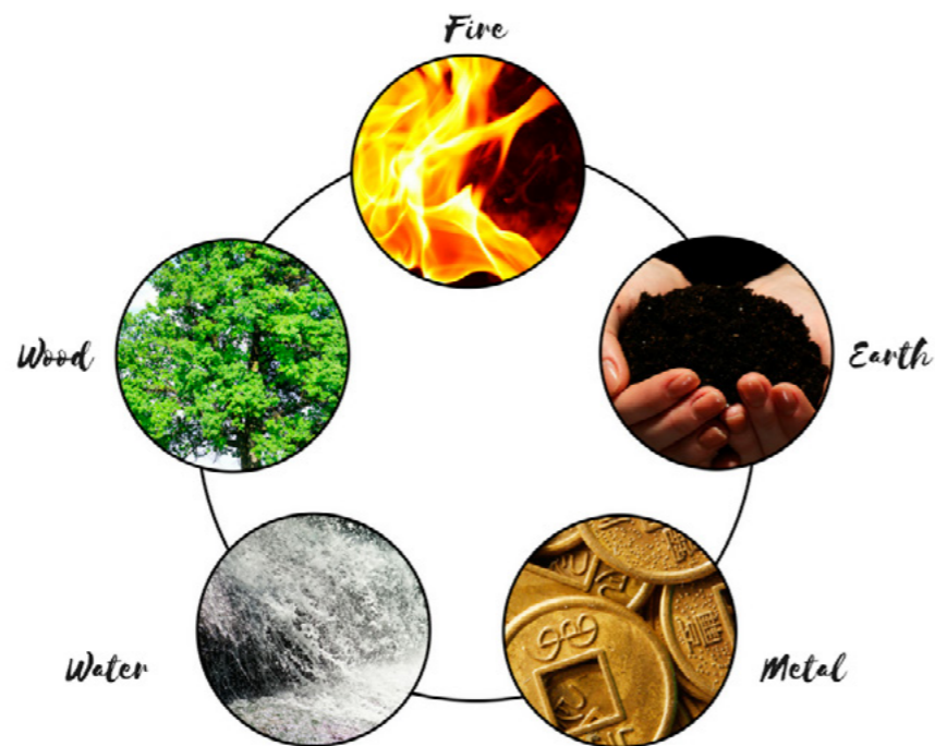
ELEMENTENE: De fem elementene har hver sine egenskaper. Det gjelder å finne den rette balansen.

Innen Feng Shui snakker vi også om Qi og hvordan den flyter - langs glatte flater (som er mer Yang) flyter qi raskt, mens langs en myk eller ru overflate (som er mer Yin) vil qi roe seg ned og flyte langsommere. Her handler det igjen om å skape en balanse hvor Qi flyter harmonisk og gunstig Qi