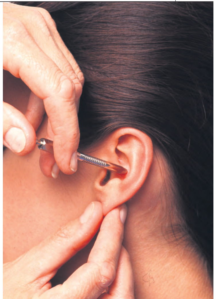
Homøopati, og til dels akupunktura, og urtemedisinen blir omtala grundig i boka.

Mange opplever dei vert hjelpte av alternativ medisin, noko det er liten grunn til å tvile på. Dei som ikkje får hjelp, høyrer vi lite frå. Det gjeld ofte vondt i hovud, nakke og rygg og angst og depresjon der psykiske komponentar spelar ei sentral rolle. For mange pasientar er diagnosen viktig, den får dei av den alternative som ofte gir pasienten god tid, i alle fall ved første gongs samtale. Dessutan gir dei tru og von til pasienten, kanskje den viktigaste ingrediensen i eit godt pasient-terapeut-forhold. Når alternative metodar verkar, skjer det gjenom psykiske prosessar og ikkje